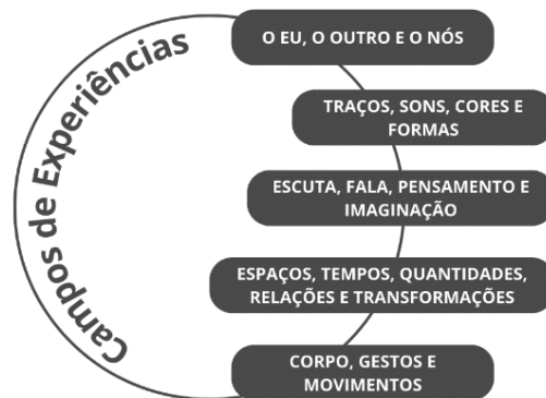
Figura: Campos de Experiências da Educação Infantil

34. Observe a seguinte figura sobre campos de experiências: