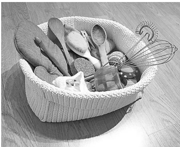
Cesto dos tesouros.

44. A figura abaixo representa o cesto dos tesouros: