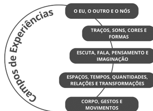
Figura: Campos de Experiências da Educação Infantil

34. Observe a seguinte figura sobre campos de experiências: