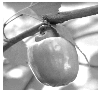
Imagem da Campanha

https://www.opovo.com.br/divirtase/2023/10/14/comercial-com-